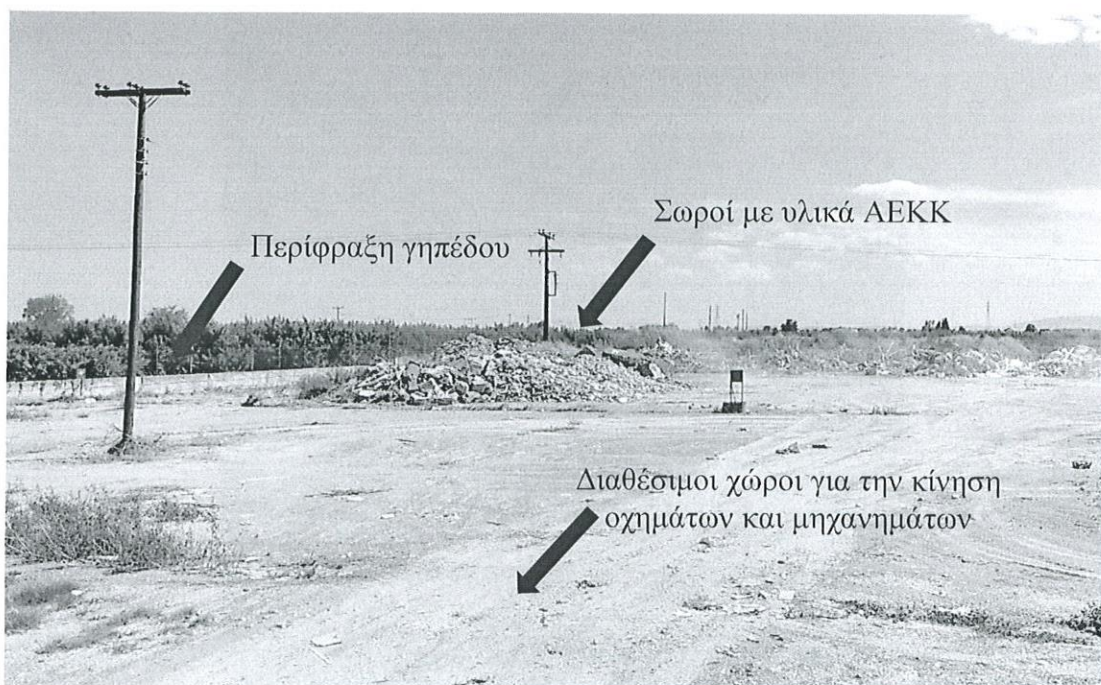
Εικόνα 1: Φωτογραφία γηπέδου 1