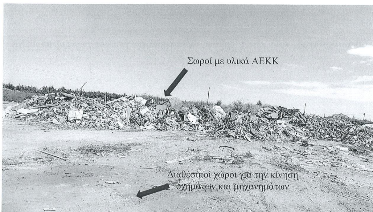
Εικόνα 2: Φωτογραφία γηπέδου 2