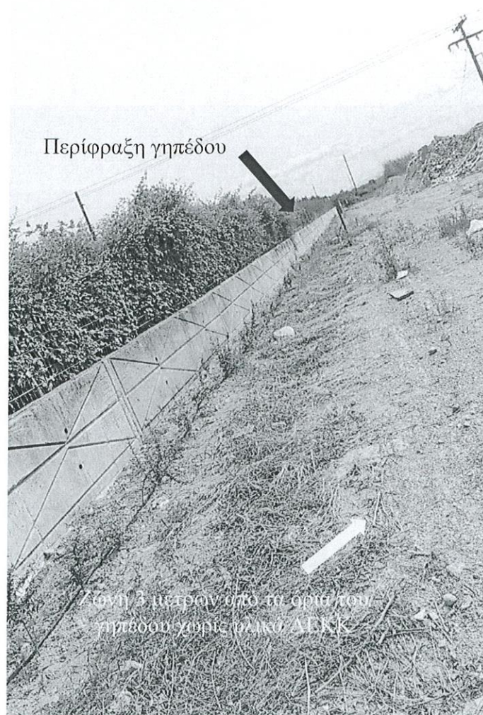
Εικόνα 3: Φωτογραφία ζώνης 3 μέτρων από τα όρια του γηπέδου χωρίς υλικά ΑΕΚΚ